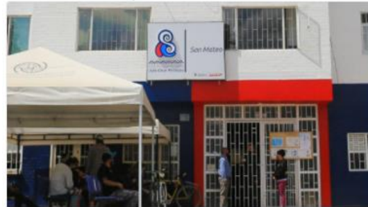
Sede San Mateo

Dirección: Carrera 2 #12-38 Teléfono: 7293922 Opción 4 y Opción 1 Horario de Atención: Lunes a Viernes: 7:00 am – 5:00 pm Sábado: 8:00 am – 12:00 pm