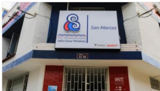
Sede San Marcos

A continuación, se relaciona la información de cada una de las sedes asistenciales de la ESE, las cuales se encuentran en las comunas 1 (Compartir), 3 (Olivos), 4 (Ciudadela Sucre), 5 (San Mateo) y 6 (San Marcos) este último que atiende población de la comuna 2 aun cuando no se encuentra ubicado en esa comuna.